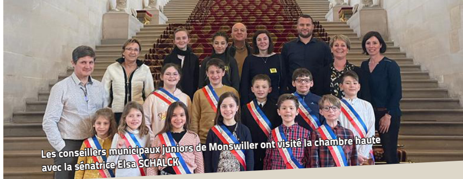
Les conseillers municipaux juniors de Monswiller ont visité la chambre haute avec la sénatrice Elsa SCHALCK