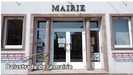
Balustrade de la mairie