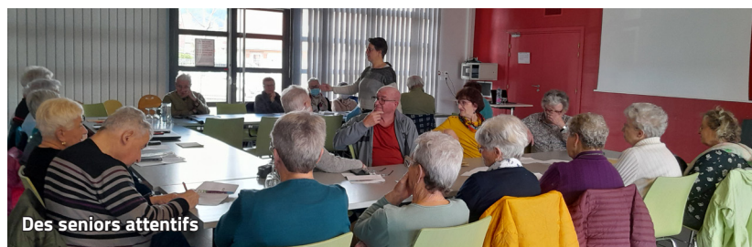
Des seniors attentifs

27 membres du club des seniors étaient présents à cette réunion le jeudi 30 mars à la Salle Carmin.