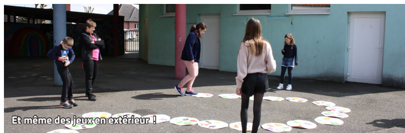
Et même des jeux en extérieur !

La Confédération Syndicale des Familles (CSF 67) a proposé une après-midi «Jeux de société» durant les vacances scolaires d'Avril, le mercredi 26 avril 2023 à la Médiathèque de Monswiller. Elle propose ces activités depuis quelques années, en partenariat avec la Médiathèque, la Mairie de Monswiller et la CAF Bas-Rhin. L'objectif est de réduire le temps d'écran en partageant un moment convivial avec d'autres enfants et parents.