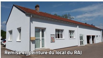
Remise en peinture du local du RAJ

Quelques travaux ont été réalisés en ce premier semestre :