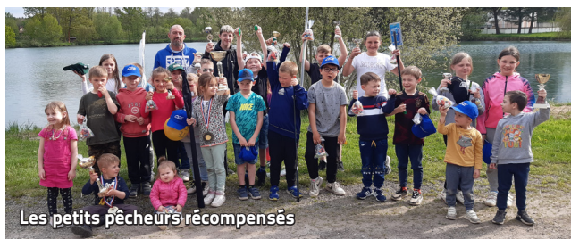
Les petits pêcheurs récompensés

Les membres de l'Association de pêche et de Pisciculture ont eu plaisir à accueillir, le lundi 1 er mai, les jeunes pêcheuses et pêcheurs de la commune.