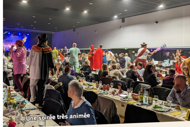
Une soirée très animée

info 07 56 37 74 63 / 03 88 23 43 60 / familles@lacs67.org