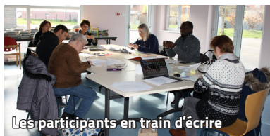
Les participants en train d'écrire

Un nouveau cycle d'ateliers d'écriture, animé par Martine Wollenburger, a débuté à la médiathèque samedi 4 février.