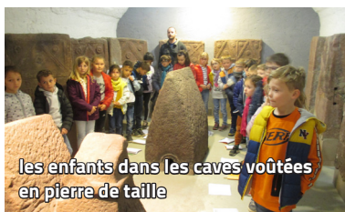
les enfants dans les caves voûtées en pierre de taille