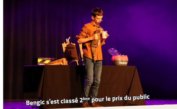
Bengic s'est classé 2 ème pour le prix du public

italiens, allemands, de chants liturgiques mais aussi des prières. Un programme hétéroclite sublime avec les jeux d'orgue de Sébastien Naegel, sous la direction de Dominique Boss et présenté par Florent Reinberger. Les spectateurs se sont laissés emporter dans ce voyage mélodieux à travers le temps, en l'honneur de la Sainte Vierge Marie.