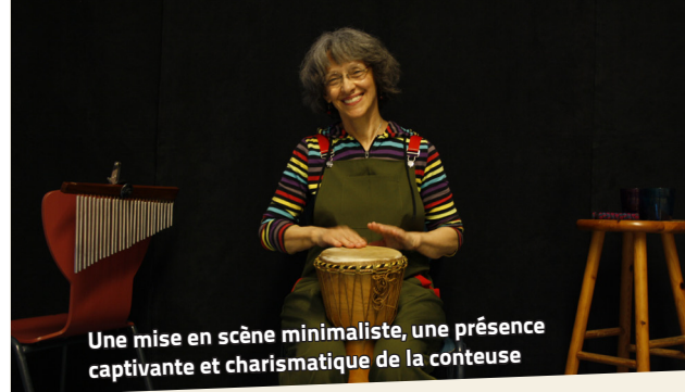
Une mise en scène minimaliste, une présence captivante et charismatique de la conteuse

Un professeur en magie expérimenté a donné des cours très pointus aux enfants. Des jeux de sociétés inspirés de l'univers magique étaient mis à disposition les soirs pour se détendre et rigoler entre amis. De grands bricolages comme la cheminée des Dursley ou encore le tapissage du péricolaire pour qu'il ressemble au chemin de traverse ont été réalisés. Des peintures sur les vitres, des puzzles et des dessins ont été réalisés par les enfants.