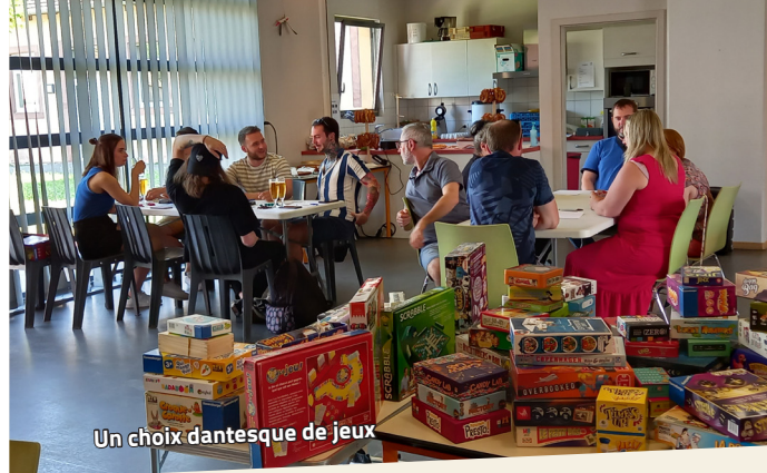
Un choix dantesque de jeux

monswiller.fc@alsace.lgef.fr / https://fcmonswiller.pagesperso-orange.fr/