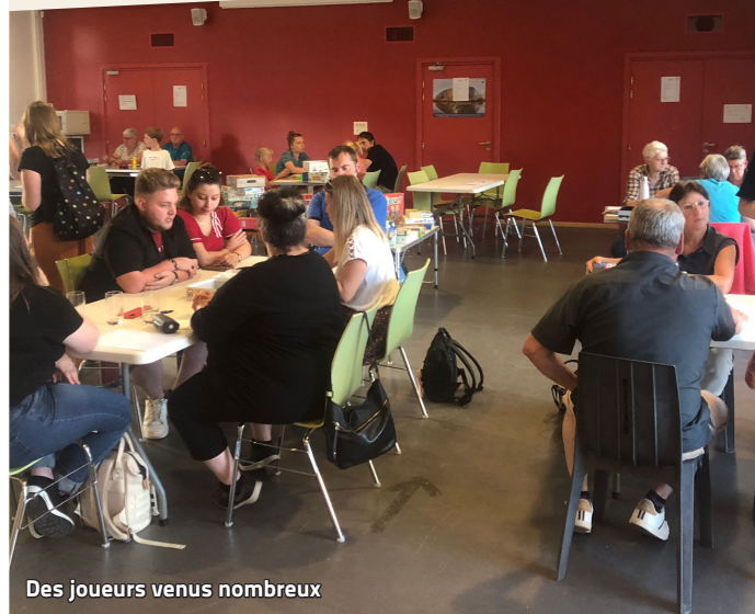
Des joueurs venus nombreux