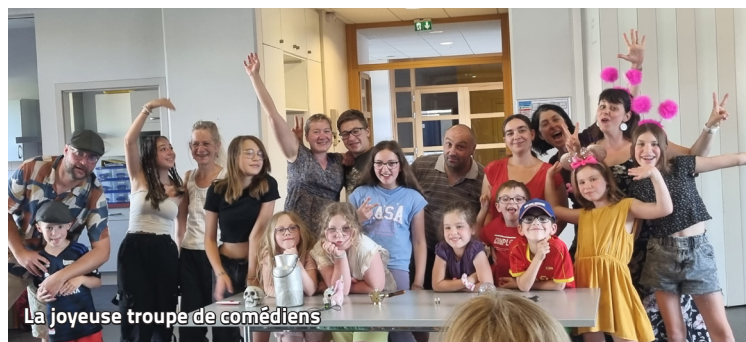
La joyeuse troupe de comédiens