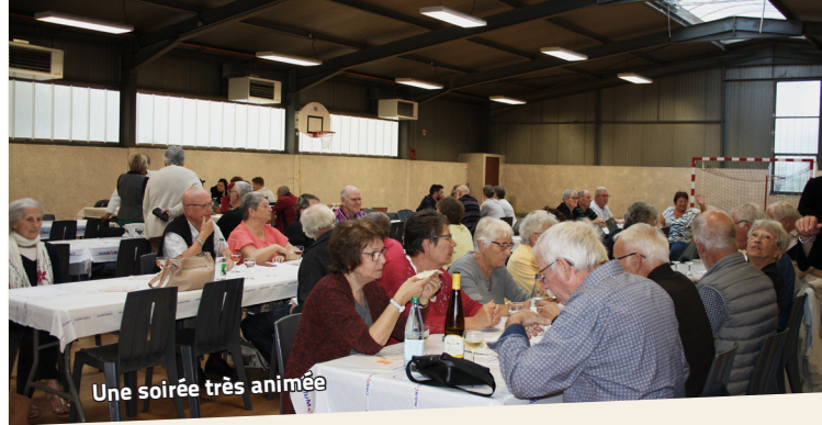
Une soirée très animée