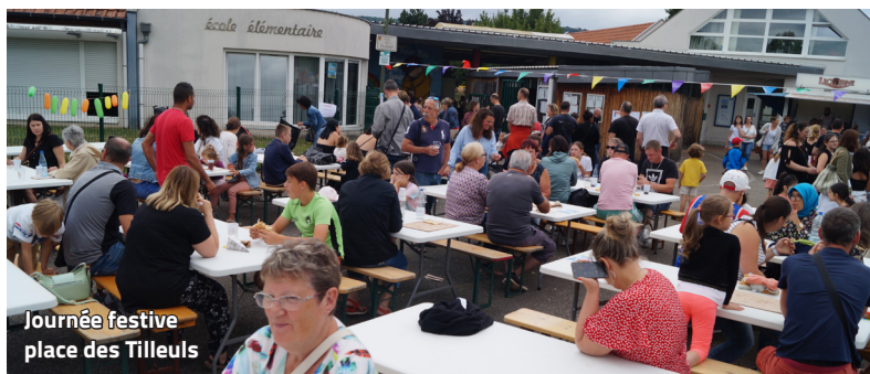
Journée festive place des Tilleuls

Ainsi de 10 h à 12 h, les enfants et leurs familles se sont amusés à 1,2,3 commando, à la pêche aux canards, à l'atelier maquillage, à la course de sacs à patates, d'œuf, de trottinettes, de draisiennes et de brouettes. D'autres ateliers comme le pont, l'archéo-sable, l'initiation à la slackline et à la magie, le lancer d'anneaux, le mikado, la découverte des échecs, du jeu du morpion et du jeu de dés et de gobelets ou encore les ateliers de basket, handball, football ont permis aux enfants de passer un beau moment.