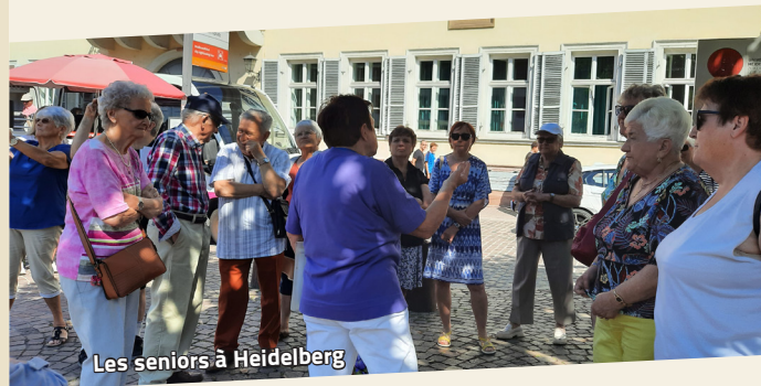
Les seniors à Heidelberg

Cette sortie a clôturé la saison 2022-2023.