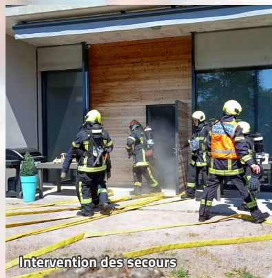
Intervention des secours

L'évacuation s'est passée dans le calme vers le point de rassemblement prédéfini en cas d'incident à l'arrière du bâtiment.