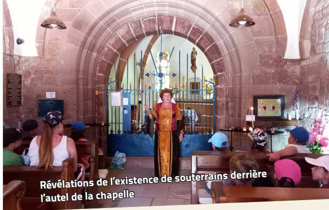
Révélation de l'existence de souterrains derrière l'autel de la chapelle