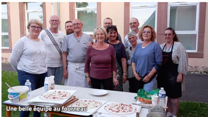
Une belle équipe au fourneau

Ce jeudi 25 mai, la nouvelle amicale des donneurs de sang, qui fête son premier mois d'existence, a remporté un franc succès ! Ainsi, ce sont 53 donneurs qui se sont mobilisés dont 10 primo donneurs. Un très beau score -le dernier datant d'août 2018- qui encourage cette nouvelle équipe pour les collectes à venir.