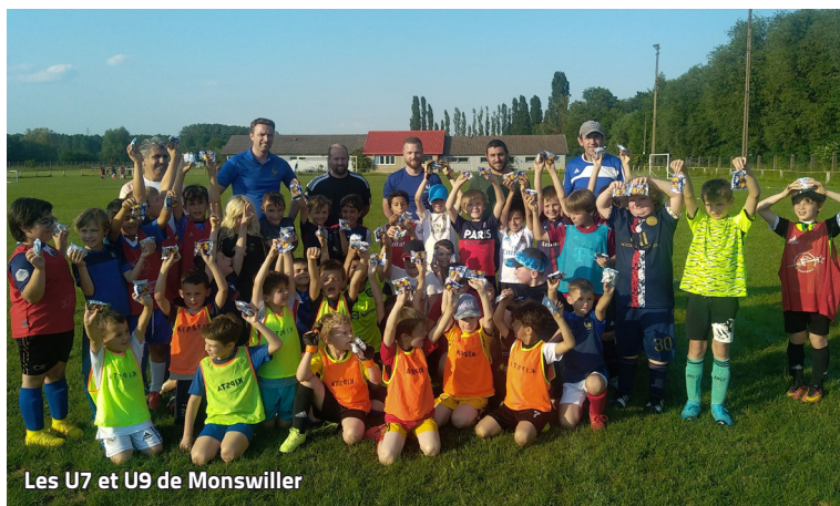
Les U7 et U9 de Monswiller

Par ailleurs, nous sommes également toujours à la recherche de personnes ayant du temps à consacrer à notre association, que ce soit pour l'entretien des installations, l'organisation des manifestations ou pour l'encadrement sportif, notamment des plus jeunes.