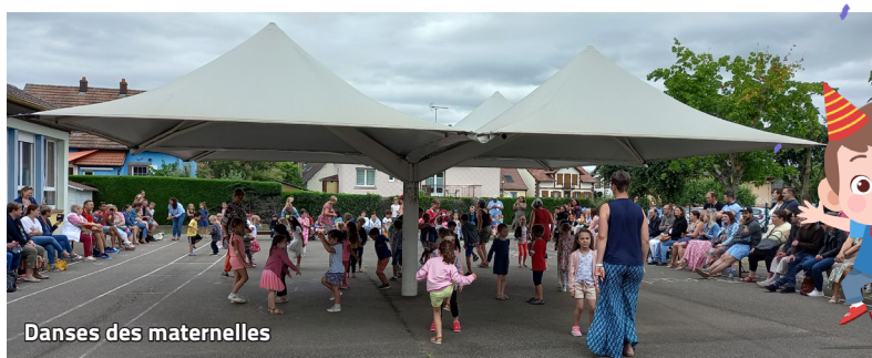
Danses des maternelles

Les festivités se sont poursuivies sur la place des Tilleuls où une restauration - dîner, repas asiatiques et tartes flambées-pizzas - et une buvette ont permis de régaler les estomacs affamés. Cet événement, organisé par l'équipe pédagogique et l'association de parents d'élèves «Les Lionceaux» a été couronné de succès. Les familles ont pu enfin découvrir les classes de leurs enfants après une période marquée par les restrictions.