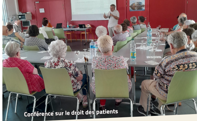
Conférence sur le droit des patients

Tout au long de la journée, sous quarante degrés, les membres de l'association ont préparé des grillades et tartes flambées. Prochain rendez-vous en juin 2024 avec davantage d'exposants.