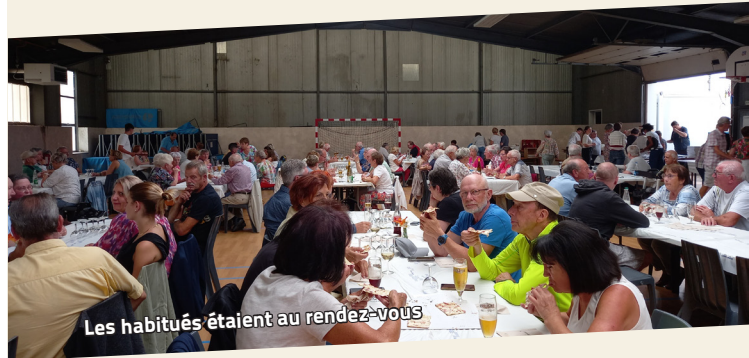
Les habitués étaient au rendez-vous

Plus de 200 tartes flambées et pizzas ont été servies. Les membres de la chorale remercient chaleureusement les participants et bénévoles ayant contribué à la réussite de cette soirée.