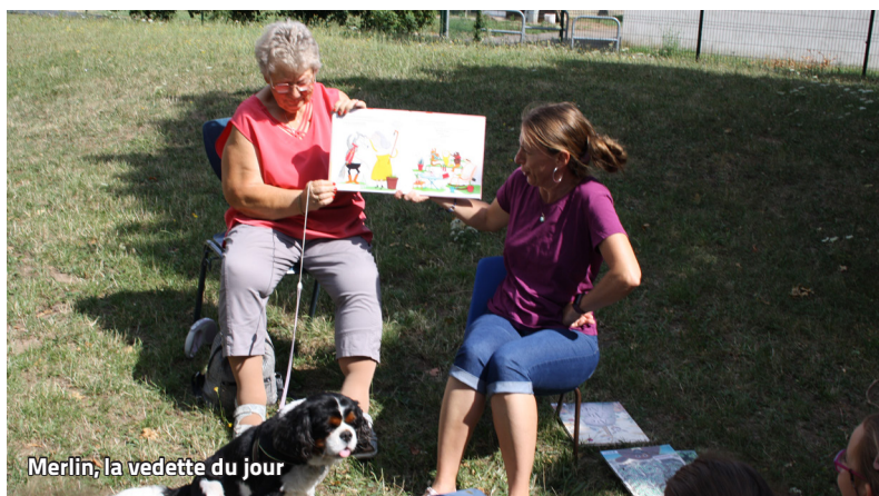
Merlin, la vedette du jour