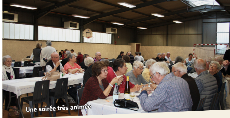
Une soirée très animée

Billetterie disponible sur www.lezornhoff.fr et dans les différents points de vente : au Zornhoff le mercredi de 14 h à 17 h, à l'office de tourisme du Pays de Saverne, Wasselonne et Phalsbourg, Super U Saverne et Ingwiller, Leclerc Marmoutier, Wasselonne et Sarre-Union, Tabac à l'ancienne Gare à Dettwiller. Possibilité d'acheter des billets le soir même.