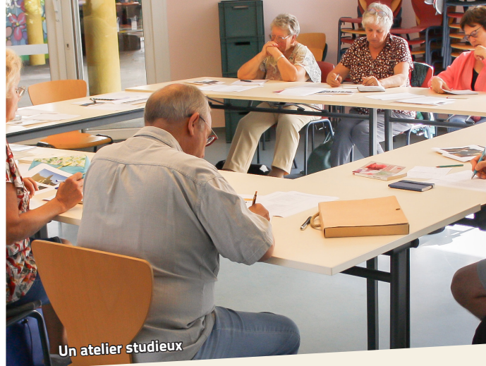
Un atelier studieux