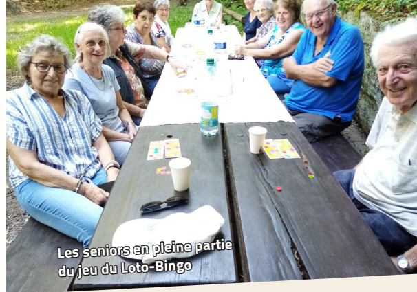
Les seniors en pleine partie du jeu du Loto-Bingo