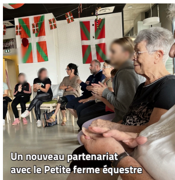
Un nouveau partenariat avec la Petite ferme équestre