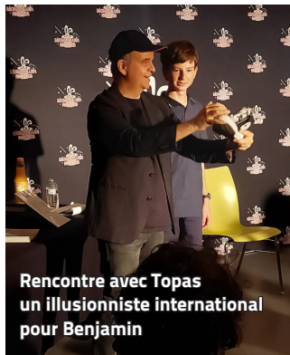
Rencontre avec Topas un illusionniste international pour Benjamin

Cet automne, le Monswiller Magic Club a organisé une conférence avec le célèbre Topas -magicien professionnel d'origine allemande aux nombreux tours d'illusions mondialement connus.