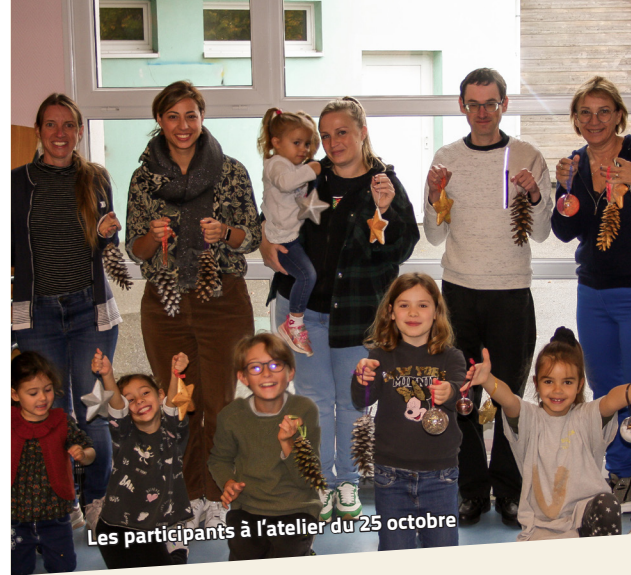
Les participants à l'atelier du 25 octobre