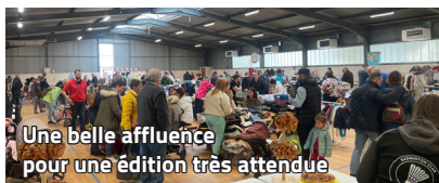
Une belle affluence pour une édition très attendue