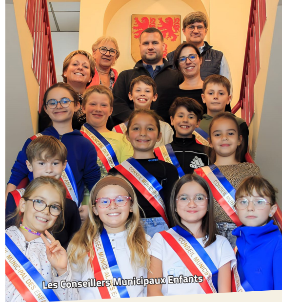
Les Conseillers Municipaux Enfants