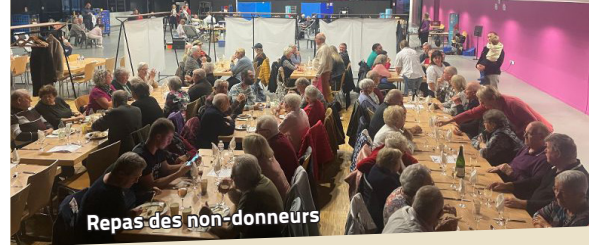
Repas des non-donneurs