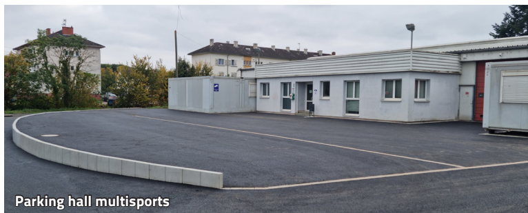
Parking hall multisports

La vente de la friche industrielle Grauvogel à un promoteur immobilier, en 2023, a déclenché un processus de réflexion au sein du conseil municipal. Très rapidement, l'idée d'un aménagement, voire d'un embellissement de cette zone, a émergé. Aménager le parking du hall multisports et faciliter l'accès aux installations du club de foot (FCM) ont été les deux axes forts. Avant sa destruction, il est à préciser que la buvette n'a livré aucun des secrets ni témoignages du passé.