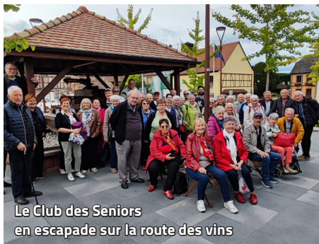
Le Club des Seniors en escapade sur la route des vins

Mardi 16 septembre 2025, 48 membres du Club des Seniors de Monswiller ont profité d'une belle journée d'automne pour découvrir Eguisheim et ses environs, sur la route des vins d'Alsace. À bord du petit train touristique, ils ont parcouru vignobles, villages typiques et sites historiques, guidés par une accompagnatrice passionnée.