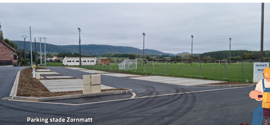
Parking stade Zornmatt

Gageons que l'intelligence collective des uns et des autres permettra de garder ces nouveaux espaces propres le plus longtemps possible.