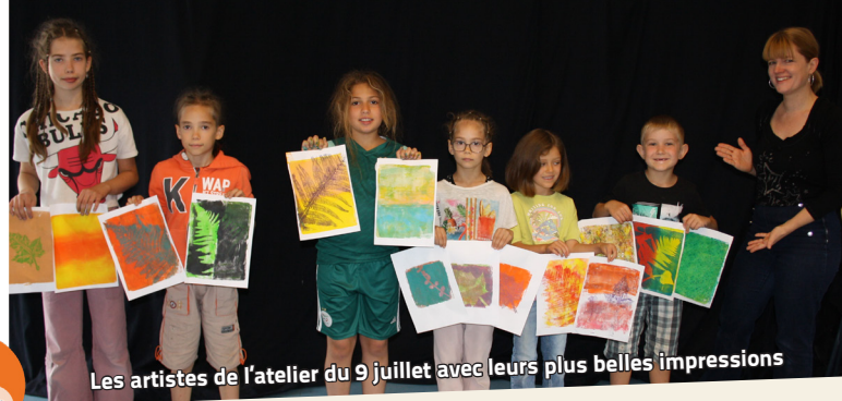
Les artistes de l'atelier du 9 juillet avec leurs plus belles impressions

Animé par des professionnelles en gérontologie, l'atelier s'est appuyé sur le jeu « Je me souviens – Ich erinnere mich », conçu par Part'Âges et le lycée Jules Verne. Par équipes, les participants ont relevé des défis sensoriels et intellectuels (odeurs, objets, blind test, calculs, histoires...). Un moment stimulant, chaleureux et apprécié, fidèle à l'esprit de la Semaine Bleue : valoriser les aînés et encourager le lien social.