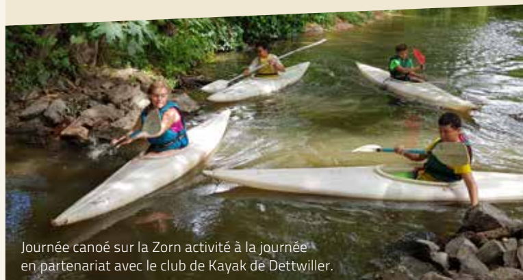
Journée canoé sur la Zorn activité à la journée en partenariat avec le club de Kayak de Dettwiller.

Cour de la mairie 67700 MONSWILLER / www.reseau-animation-jeunes.fr 03.88.71.86.23 / contact@reseau-animation-jeunes.fr