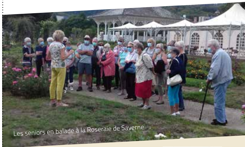
Les seniors en balade à la Roseraie de Saverne

Avec cette rentrée bien particulière, la participation se fait sur inscription préalable auprès de l'UD CSF 67: COLLOT-BOUCHARD Mélanie 03.88.23.43.60 / epi.csf67@orange.fr . Le port du masque est obligatoire à partir de 11 ans. Les enfants doivent être accompagnés d'un parent, grand-parent, tonton/tata, durant les ateliers.»