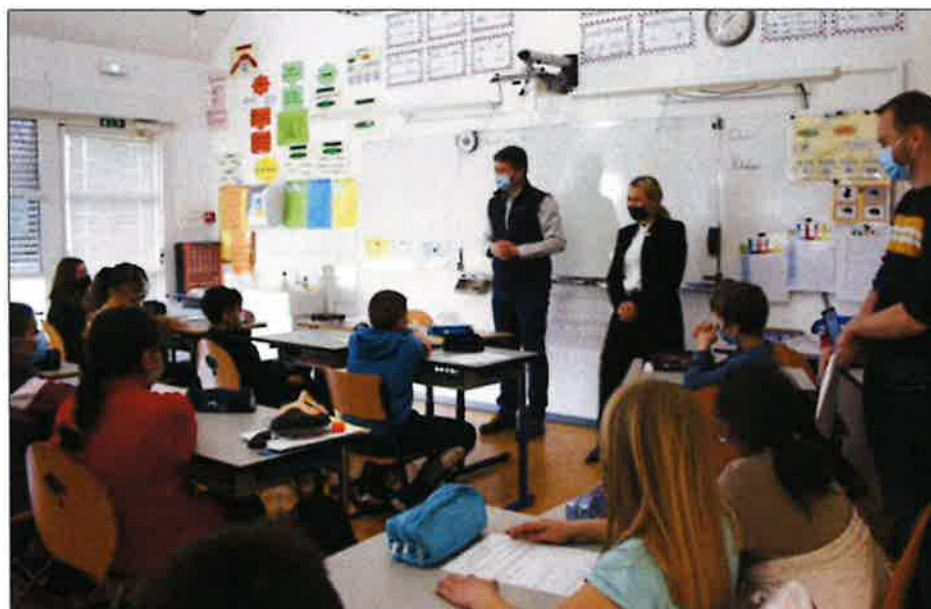
L'opération de sensibilisation au harcèlement a été menée auprès des CM1 et CM2 du groupe scolaire Arc-en-ciel.

Élue en 2020, Elsa Schaleck, représentante des 514 communes du Bas-Rhin au Parlement et en charge d'une mission d'information sur le harcèlement au Sénat, a à cœur de rencontrer et d'échanger avec les scolaires. Ses missions de terrain lui permettent de cibler au mieux les problématiques des en-