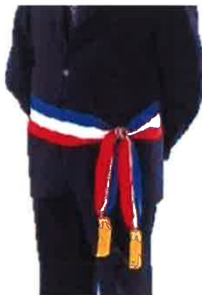
Port en ceinture Bleu vers le haut

L'écharpe tricolore peut se porter soit en ceinture soit de l'épaule droite au côté gauche. Lorsqu'elle est portée en ceinture, l'ordre des couleurs fait figurer le bleu en haut. Lorsqu'elle est portée en écharpe, l'ordre des couleurs fait figurer le bleu près du col, par différenciation avec les parlementaires.