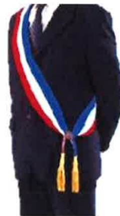
Port en écharpe Bleu vers col